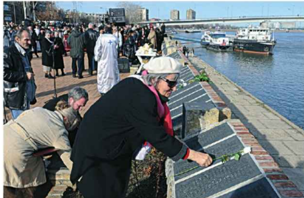
НЕЗАБОРАВ Традиционални помен на 1.300 жртава рације

А, вечерас у 19 часова, у великој сали КЦНС (Католичка порта 5) биће приказан први од три играна